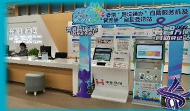
「跨境通办」自助服务机 及 「智方便」自助登记站