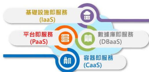
政府云端设施服务