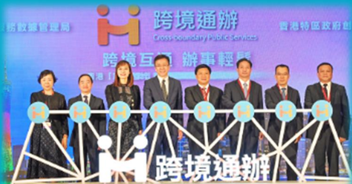
「跨境通办」合作成果 发布会 2023年11月