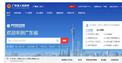
广东省政务服务网