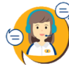
聊天机械人即服务